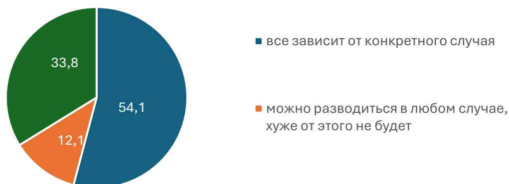
Рисунок 3. Распределение ответов респондентов на вопрос «С каким из приведенных ниже мнений Вы бы согласились?», %.

Более половины респондентов отметили, что вопрос развода зависит от конкретного случая. Ни один из респондентов не выбрал вариант «Разводиться нельзя, нужно сохранить брак любой ценой» (рис. 3).