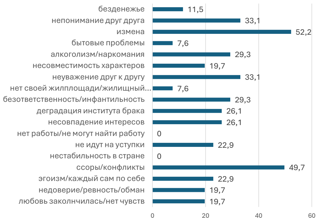
Рисунок 2. Распределение ответов респондентов на вопрос «Что, по Вашему мнению, чаще всего вынуждает людей к разводам?», %

Более половины респондентов отметили, что вопрос развода зависит от конкретного случая. Ни один из респондентов не выбрал вариант «Разводиться нельзя, нужно сохранить брак любой ценой» (рис. 3).