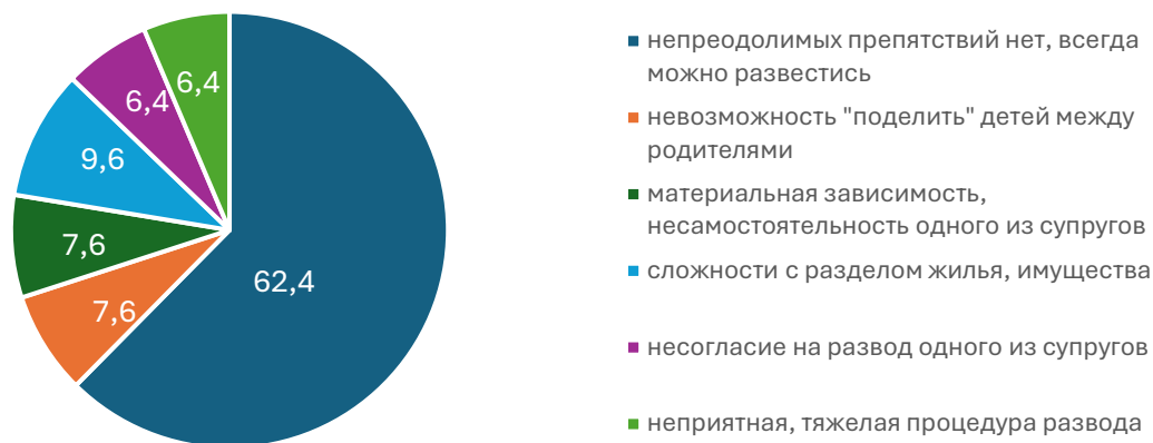
Рисунок 4. Распределение ответов респондентов на вопрос «Представьте себе пару, которая решила развестись. На Ваш взгляд, что может им помешать это сделать?», %.

Две трети респондентов не видят для себя непреодолимых препятствий для развода. Практически равные доли опрошиваемых (7,6-9,6%) ответили, что причинами могут быть: невозможность «поделить» детей и материальная зависимость одного из супругов (рис.4).