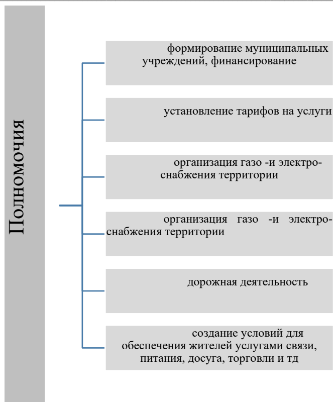
Рисунок 2. Круг основных полномочий муниципалитетов

На данный момент, учитывая специфику деятельности муниципального управления и пересмотра акцента полномочий именно на региональные власти, стоит сказать о наличии ряда проблем, мешающих эффективному функционированию [22, с. 7]. Сложность заключается в том, что каждое муниципальное образование обладает уникальными правовыми структурами, что делает процесс унификации регламентов более трудоемким. Действующие уставы муниципалитетов отражают специфику и приоритеты их управленческих структур, что позволяет лучше адаптировать правовые нормы к местным условиям.