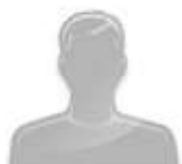
Фото (по желанию)

НАЗВАНИЕ СТАТЬИ (TIMES NEW ROMAN, 16 PT., ПОЛУЖИРНЫЙ, ПО ЦЕНТРУ)