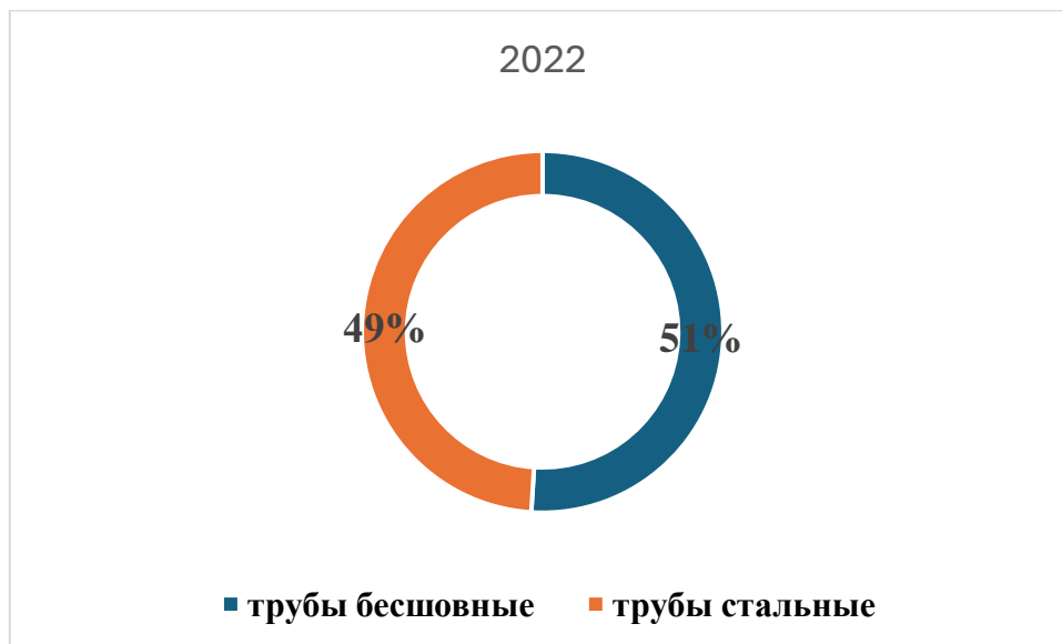
Рисунок 2. Валовая структура производства труб в Российской Федерации в 2022 году

Валовая структура производства труб в 2022 г. представлена на Рис. 2.