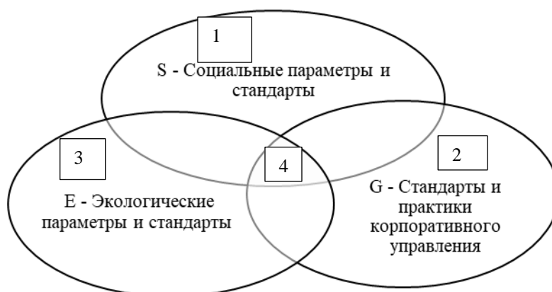
Рис. 2: Факторы, определяющие структуру рисков игнорирования использования ESG-практик компаниями 10

В силу сложности хозяйственных процессов и описанных выше тенденций мы имеем дело с целой системой рисков игнорирования использования ESG-практик компаниями, которые выделены нами на рис. 2 и кратко описаны в таблице 1.